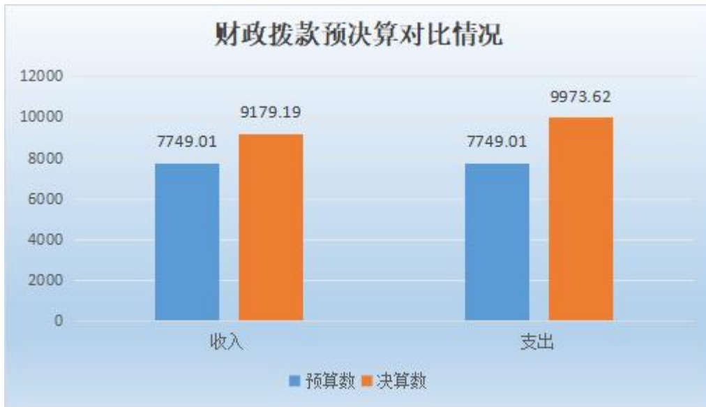
图 5：2022 年度财政拨款预决算对比情况（单位：万元）