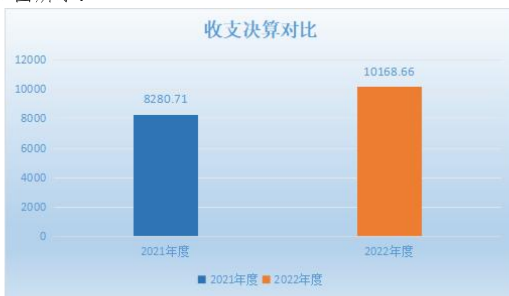
图 1: 2021-2022 年度收支总计对比情况（单位：万元）