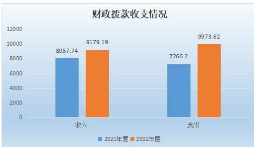
图 4：2021-2022 年度财政拨款收支情况（单位：万元）